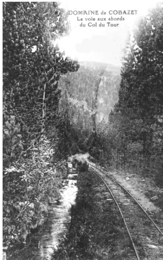
La voie ferrée, au milieu des pins, avec le ruisseau qui alimentait Covazet. Du Caillau au Col "del Tour" elle a été transformée en piste carrossable. A partir du "col del Tour" on en retrouve quelques traces.

Il semblerait que la première voie ferrée ait re-