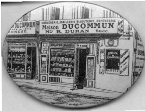
médaille du magasin en 1920

Lorsqu'en 1939 ma mère la reprit, le sieur Glanes avait disparu avec le stock et laissé les locaux dans un état lamentable.