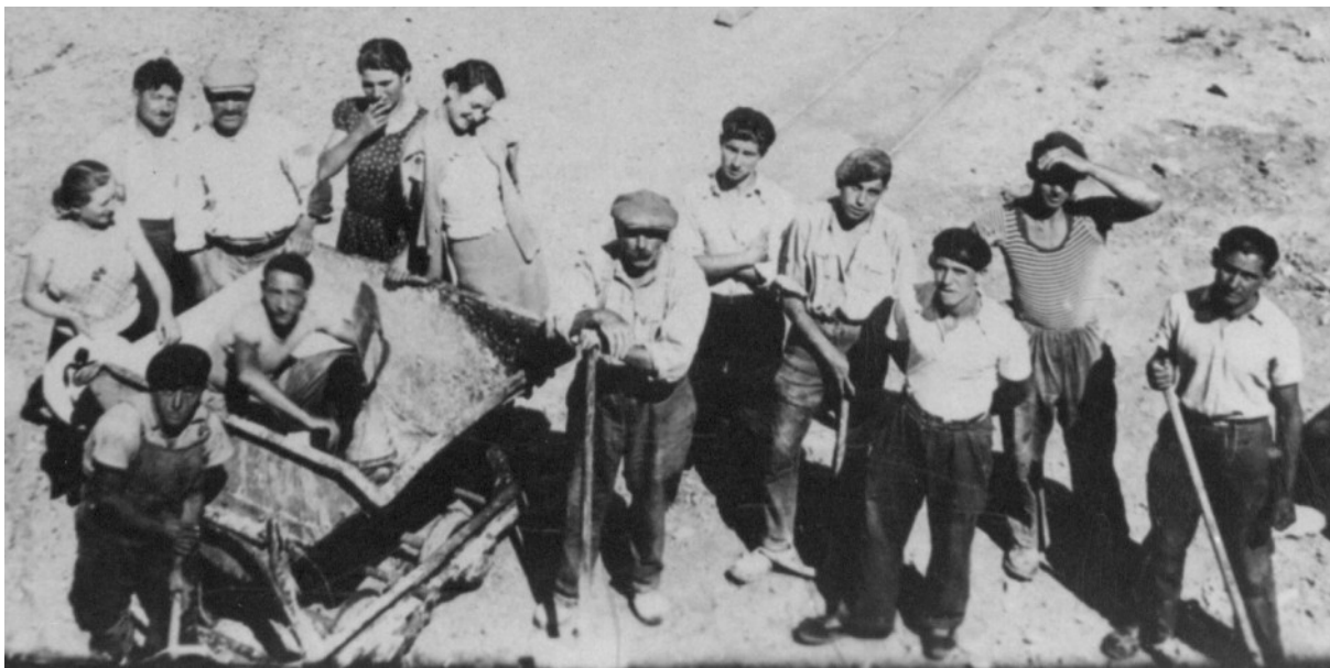
Une équipe de mineurs sur le site du Caillau.