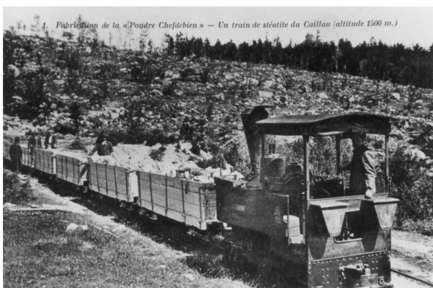
Train de talc au Caillau.