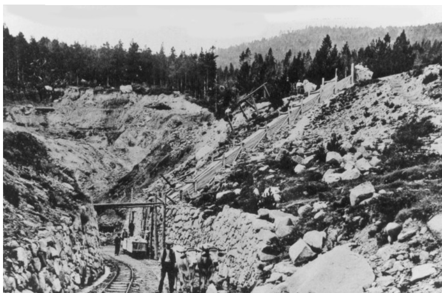
Une paire de vaches attelées permettait de remonter les wagonnets vides du Caillau à la Carrière.