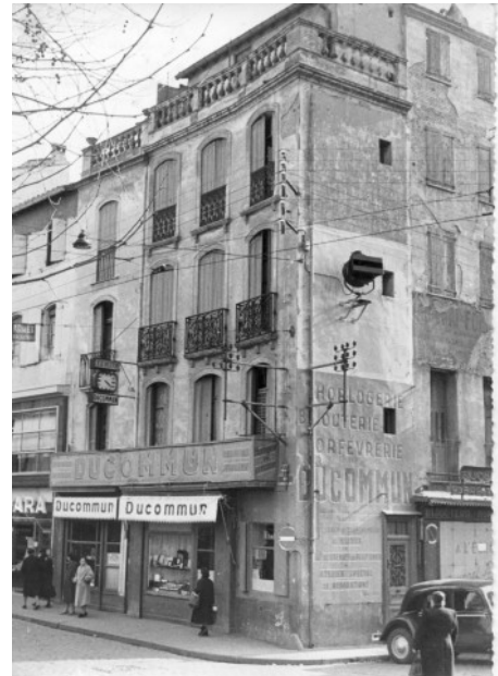
Composé de 3 immeubles (ci-dessus) démolis fin 1954, pour donner naissance à l'actuel bâtiment (ci-dessous)

En 1954, on constitua, avec les quatre immeubles, une S.C.I. (Société Civile Immobilière) qui prit la décision de démolir les quatre vieilles maisons et de construire, à la place, un immeuble de quatre étages, dont la cave, le rez-de-chaussée et le premier étage seraient destinés au magasin ainsi que le quatrième, pour les réserves. La S.A.R.L. fut transformée en S.A. (Société Anonyme).