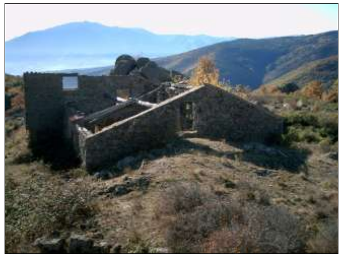
Le Cortal Descazat