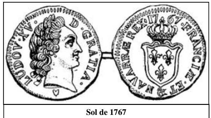
Sol de 1767

Les communes reçoivent une aide financière pour participer à la disparition de la mendicité et de l'indigence. A Molitg une trentaine de familles ou de veuves reçoivent de 5 à 20 livres chacune pour un total de 130 livres 6 . Rappelons que le prix de la journée de travail varie en fonction de la saison de 1,25 à 1,5 livre. L'aide apportée va donc de 3 à 16 journées..